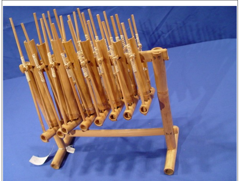
Musikinstrumente von A-Z