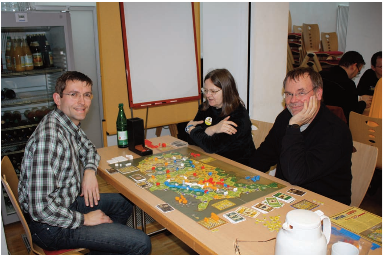
Settlers of America beim AOU-Con