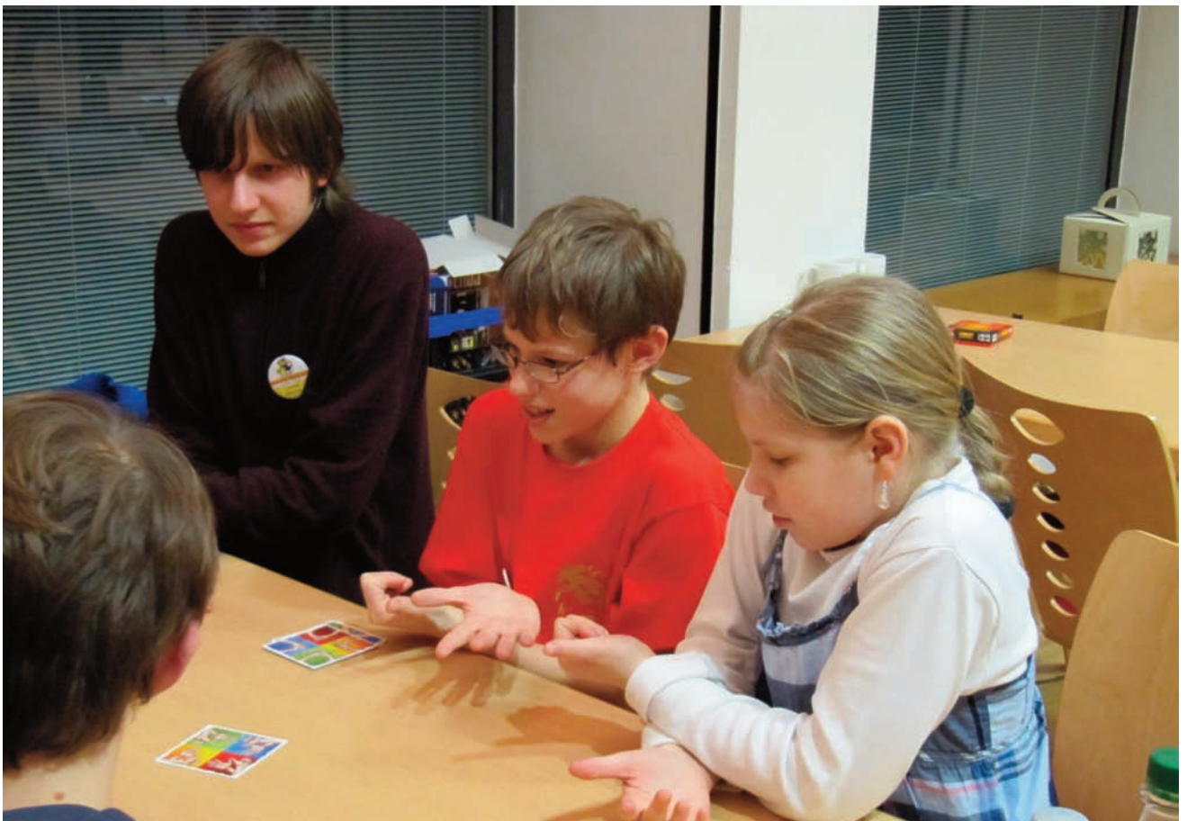
Spielernachwuchs beim AOU-Con