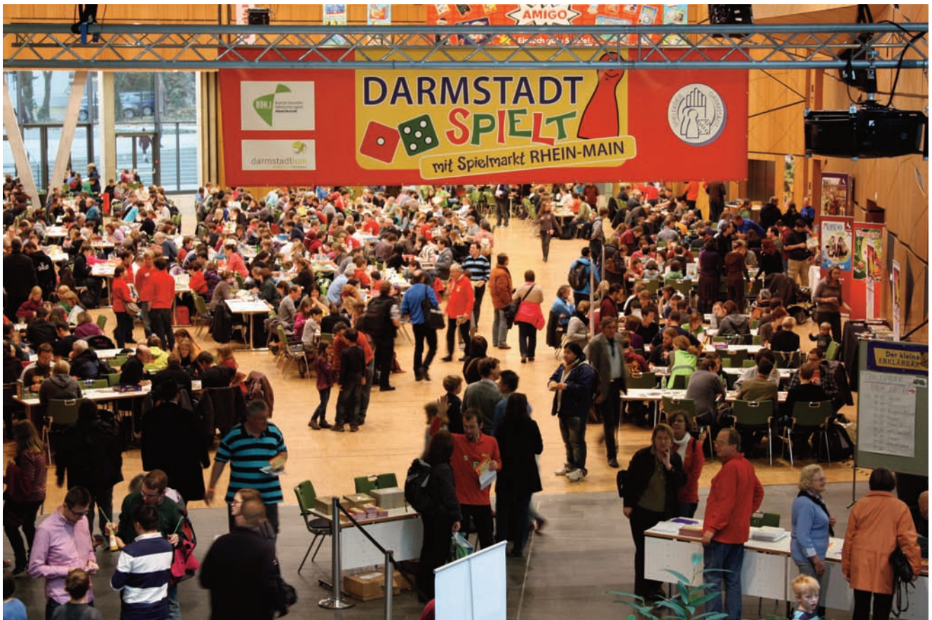
Darmstadt spielt 2011