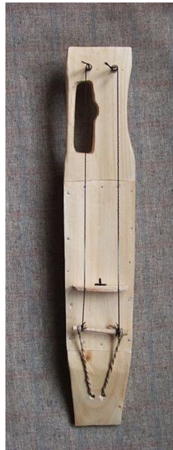
Musikinstrumente von A-Z Heute J wie Jouhikko

Ein Jouhikko ist ein traditionelles Instrument der finnischen Volksmusik. Sie wird auch häufig als Jouhikannel bezeichnet, was die Verwandtschaft mit der Kantele bezeugt. Es handelt sich um eine Art Geige. Sie wurde früher für finnische Volkslieder gebraucht, heute gibt es sie immer seltener. Die Saiten sind traditionell aus Rosshaar. Nachbauten besitzen Nylon- oder auch Metallsaiten. Eine Band, die dieses Instrument immer noch benutzt, ist die Folk-Metal-Gruppe Korpiklaani.